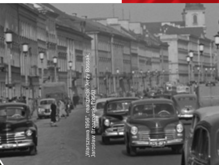
„Warszawa 1956”, realizacja: Jerzy Bossak, Jarosław Brzozowski (1956)