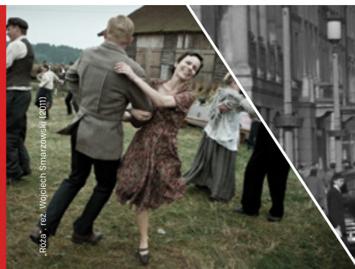
„Róża”, reż. Wojciech Smarzowski (2011)